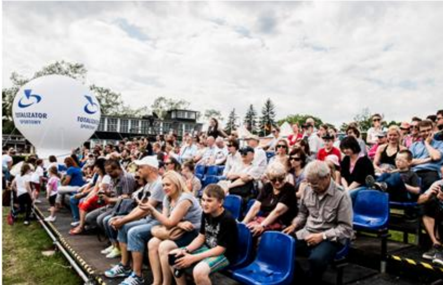
Wartość mediowa wydarzenia

Wartość mediowa, czyli rzeczywista wartość całego wydarzenia CSIO*** 2014 wyniosła 4,9 mln zł.